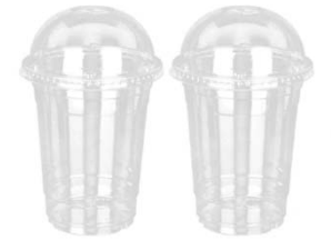
Κυπελλάκια για ποτά, καλύμματα και καπάκια.