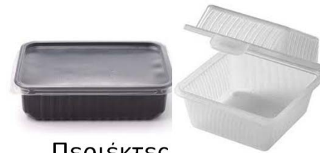
Περιέκτες τροφίμων, δλδ δοχεία όπως κουτιά, με ή χωρίς κάλυμμα, εντός των οποίων τοποθετούνται τρόφιμα.